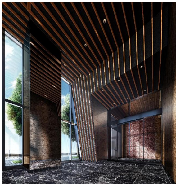
▲エントランスホール完成予想 CG ※6

空間設計には、二層吹き抜けの開放的なエントランスホールや、天然石を配したオーナーズラウンジ、ゲストルームなどを設け、邸宅としての品格を表現しています。さらに、内廊下設計を採用することで、高いプライバシー性と防犯性を確保し、風雨にさらされない快適なアプローチを叶えます。