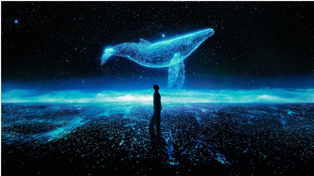
▲BEACH NIGHT BEING (NEW YORK)

また直近では、本年韓国ボーイズグループのBTSとのコラボレーションを実現し、音楽界の新たな没入体験の取り組みでも世界中に名を広めています。