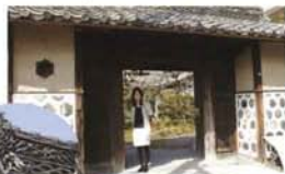
生駒殿敷の中間を移築した真岡家の門(布袋町) 種瓦・境瓦の置入は必須。

があれば、街道が。丸井、小折に関わり、深い街道が岩倉街道で、別名「柳街道」と親しまれました。これは、道沿いに柳や松が植えられたた