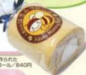
入鹿池(大山)にある養蜂場で作られたハチミツをつかったハチミツロール / 840円