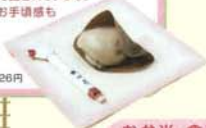
船越 三商菓 / 126円

「大口屋」の創業は文政元年(1818)で、本店は江南市でも古い町並みが残る布袋町にあります。尾張地方では古くからよく餅が食べられていたが、その匙を活用しようとする研究し、昭和48年(1973)に発売したのが、「船越 三商菓」です。塩漬はまんじゅう全体に移り、品のよい和菓子として愛されています。値段は126円と、生菓子としてはお手頃感もあり、喜ばれています。江南名物としてぜひ一度ご賞味ください。