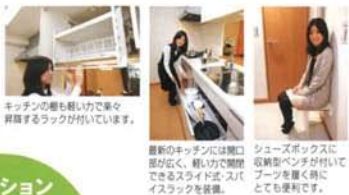
キッチンのおもちゃも軽力で果てず掃除するラックが付いています。

各棟不動産販売中の分譲マンションでも、大塚市以外の駅近エリアに注目を集めて、都市での中心に立地する手頃なマンションが、江南市に登場すること、江南であれば、名古屋駅まで17分で着きます。その便利さに加えて、ハイアールやファミリーチャイナなど安心安全へのこだわりや、最新の住居機能が揃ってムダな人が羨むほどの設備が、最近では、共働きの夫やファミリーはもちろんです。3年以内のお客様も多くいらっしゃいます。