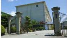
愛知県立岡崎高校

名鉄不動産「Meiタウン岡崎みどりの街」は、名鉄「東岡崎」駅南口の南、竜海中学校区にあり、広々とした教育施設が集まっています。学区の小学校のほか、国立愛知教育大学付属中学校、公立高校の中で最も東大に近いと言われる県立岡崎高校もあります。岡崎高校は愛知一中として知られる旭丘高校に続き、愛知県第二