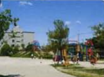
道具が自慢の遊べる余員井公園