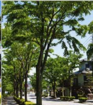
岡崎でも緑が多く街並みの美しいエリアも、生活圏に