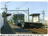
豊田に直結する愛知環状鉄道「六名」駅