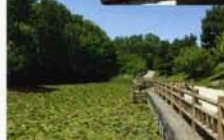
蓮が水面を覆う電美ヶ丘公園の池