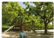
緑いっぱい乙川沿いにある明神橋公園