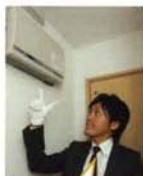
太陽光を家庭の電力に変えるソーラー発電システムです。