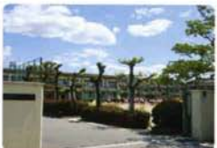
学区の六名小学校へは徒歩3分

大小さまざまなタウン開発や 分譲マンションを提供する名鉄不 動産。平成20年3月に竣工した 岡崎タワーレジデンスは、岡崎城 を望む中核エリアにあり、都市の 未来像を描くランドマークとなっ ています。