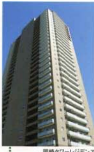
岡崎タワーレジデンス

春季同封の読者アンケートにご協力いただきありがとうございました。 アンケートでお寄せいただいたご意見・ご要望につきましては、今後の 「せきり」に出来るだけ反映させるようにして、お客様に役立つ情報を 発信してまいりますので、末永くご愛読いただくべく宜しくお願い申し上 げます。なお、ご案内のとおり当選者には、トランパスカードを送付さ せていただきました。