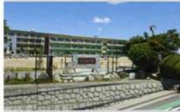
岡崎市立竜海中学校