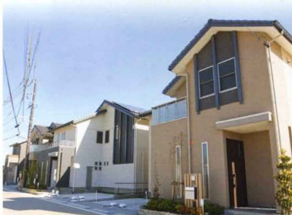
この開発地(みどりの街)では、各区画の緑化面積を10%以上として道路沿いを植栽で彩ることとしています。将来は、緑や花が街並みを飾る美しい景観が実現します