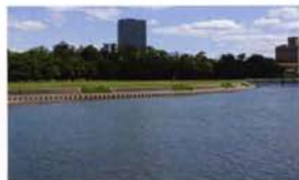
城を中心に整備された岡崎公園

岡崎に人々が住み始めたのは、約1万5000年前前の旧石器時代ですが、岡崎史のハイライトはやはり戦国・江戸時代です。徳川家康は幼少期を、今川氏と織田氏の間で人質として過ごしました。桶狭間の戦いで織田信長が今川義元を破ると、岡崎城に帰還して独立。4年後には三河を統一します。関ヶ原の戦いによって石田三成を中心とする西軍を破った家康は、慶長8年(1603)江戸に幕府を開府。徳川300年の礎を築きました。岡崎藩の石高は五万石と高くはありませんでしたが、神君生誕の地として別格の扱いを受けました。宿場町の規模も駿河国府中宿・静岡県静岡市葵区に次いで大きく、矢作川には、江戸時代日本最大の橋が架けられました。人情豊文化が交流した岡崎は、明治時代以降も西三河の中核都