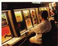
LPを再生できる視聴コーナー

町が合併。豊かな地形や森林を活かした大規模公園の整備も進められ、観光都市としても魅力を増しています。