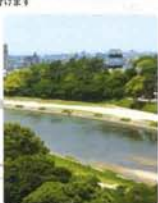
岡崎公園のほとりにある菅生川(乙川)の川辺も自転車圏内