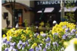
緑が似合うお洒落なカフェ