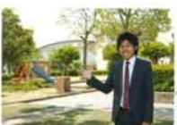
公園デビューはココ、産王公園。程よい広さで コミュニティづくりにも最適です。