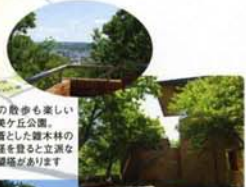
犬の散歩も楽しい電美ヶ丘公園。野営した週末の小屋を飾ると立派な景観があります