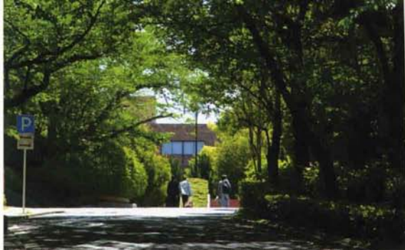
大学共同利用機関法人 自然科学研究機構。3つの研究所が設置されたことで文教区の風格が上がりました

年(1896)に開校した歴史ある高校です。さらに、昭和24年(1949)、愛知学芸大学現