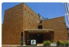
美術館も歩いて行けます