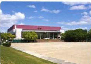
体育館とグラウンドがあり、スポーツ家族にうれしい六名公園