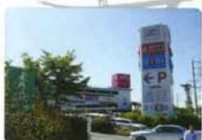
デパートや専門店が入ったイオンモール