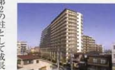
東京フォレスト ミッドガーデンシティ ザ・テラス

移設・保存・施設工事などの設計監理を担当しました。このほか、東海エリアで人気のレジャー施設「南知多ビーチランド(美浜町)、野外民族博物館リトルワールド(天山市、一部可見市)、杉本美術館(美浜町の施設)建設や、高級別荘地の開発、レジャー施設の運営など業務を拡大。建設のみならず、経営・運営の分野にも参画。これらの豊富なノウハウは、後にスタートしたホテルや介護事業にも大いに活かされています。