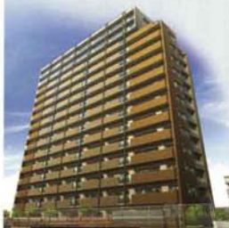
エムズシティ野並