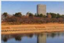
岡崎タワーレジデンス

これら住宅事業の強化を推し進めるとともに、現在では都市部での需要増が見込まれる宿泊特化型ビジネスホテル「名鉄イン」チェーンの展開、高齢者社会に向けた介護施設「名鉄マイライフあじま」の