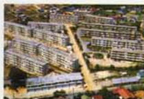
なるみグリーンコーポ

移設・保存・施設工事などの設計監理を担当しました。このほか、東海エリアで人気のレジャー施設「南知多ビーチランド(美浜町)、野外民族博物館リトルワールド(天山市、一部可見市)、杉本美術館(美浜町の施設)建設や、高級別荘地の開発、レジャー施設の運営など業務を拡大。建設のみならず、経営・運営の分野にも参画。これらの豊富なノウハウは、後にスタートしたホテルや介護事業にも大いに活かされています。