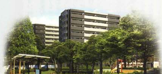
メイツ熱田八番 リーフテラス