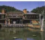
博物館明治村 帝国ホテル中央玄関