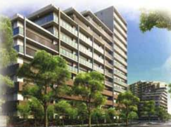
ミッドレジデンス福岡