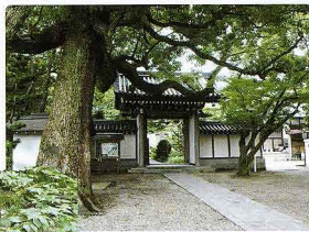
白竜寺にある年魚市湯の碑と大クスノキ

鎌倉街道はここを横切つたことと推定され、旅人あるいは熱田神宮から渡して松巨島に渡り、笠寺観音や村上社、八