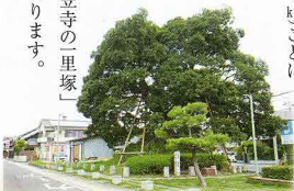
東海道の道標、笠寺の一里塚

笠寺には、名古屋市内では唯一、現存する一里塚があり、大クスノキが見事な枝振りを見せています。一里塚は、慶長9年(1604)幕府が主要街道を整備し、江戸(東京)日本橋を起点に、道程「一里(約4km)」ごとに道の両側に塚を築き、クスノキなどを植えたもので、旅人に距離を示しただけでなく、荷物その他の運賃計算の基準にもなりました。ちなみに、この「笠寺の一里塚」は江戸から88里に当たります。