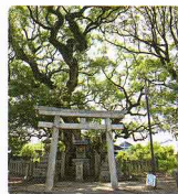
千濁の西岸にあたる村上社(南区)

当時の熱田から鳴海町や野並に至る二帯は、入り海で、桜台高校に近い村上社には、万葉集にも詠まれた桜田へ 鶴鳴き渡る年魚市 濁下 千にけらし鶴鳴き渡る(高市郡黒野人)の碑が建てられています。村上社は、千濁の西岸の船着場で、社の中心にある大クスノキは、幹周り10.8m、樹高20m。