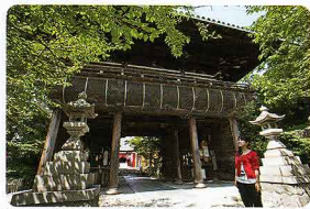
笠寺観音は略称で、天林山 笠置寺(てんりんざんりゅうぶく)

音の門前町として栄えました。寺の名前は正式には「笠覆寺」といい、創建は天平8年(736)、尾張四観音(笠寺、荒子、甚目寺、竜泉寺)のひとつで、あわせてなごや七福神の恵比須を祀っています。