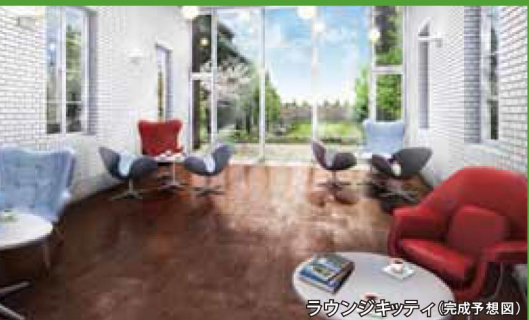
ラウンジキッチイ(完成予想図)