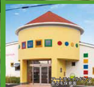
アートチャイルドケア 長久手保育園