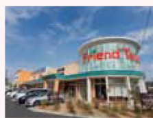
フレンドタウン長久手

また小さいながらもおしゃれなカフェや雑貨店、ベーカリーなど、若い世代に人気のショッピングも多く、利便性にファッション性もプラスされ、日々の暮らしをカラフルに演出してくれます。