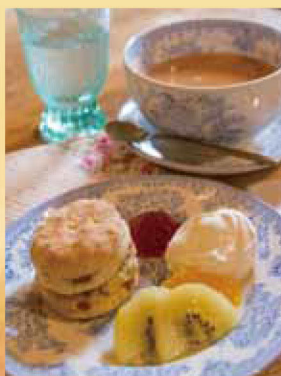
スコーンとドリンクのセット(700円)

●「アトリエKunugi」長久手市武蔵塚1303 ★Tel 0561-63-6445 ★営業時間/10:00~18:00 ★定休日/水曜日 ※金額は消費税込み料金です