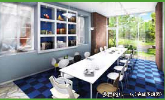
多目的ルーム(完成予想図)