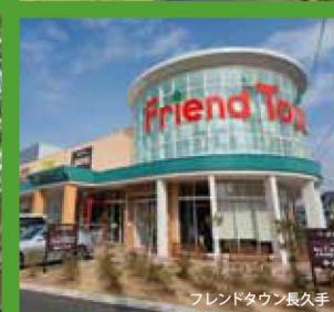
フレンドタウン長久手