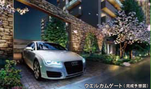
ウエルカムゲート(完成予想図)