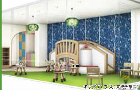
キッズハウス(完成予想図)