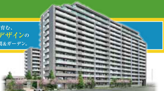
外観完成予想図 ※掲載のCGは設計図等の図面を基に描き起こしたもので、実際とは異なります。

「セントアイナ藤が丘」予告概要 ■所在地/愛知県長久手市東原山11番2、西原山118番2(地番) ■交通/地下鉄東山線/東部丘陵線(リニモ)「藤が丘」駅徒歩13分 ■地目/宅地 ■用途地域/準工業地域 ■構造・規模/鉄筋コンクリート造地上15階建 ■建ぺい率/60% ■容積率/200% ■敷地面積/12,282.98㎡ ■建築面積/5,596.04㎡ ■延べ面積/29,664.89㎡ ■建築確認番号/BCJ14大建確059(平成27年2月25日) ※今後計画変更確認申請を行う場合があります。 ■完成年月日/平成29年3月中旬(予定) ■管理形態/区分所有者全体により管理組合を結成し、管理会社へ委託 ■分譲後の権利形態/敷地・専有面積割合による所有権の共有、専有部分・区分所有権、共有部分:専有面積割合による所有権の共有 ■総戸数/291戸 ■予定販売戸数/未定 ■予定販売価格/未定 ■間取り/2LDK+SR(サービスルーム(納戸))~4LDK ■専有面積/70.68㎡~100.72㎡(トランクルーム面積含む) ■バルコニー面積/10.25㎡~17.67㎡ ■ルーフバルコニー面積/39.63㎡~54.75㎡ ■サービスバルコニー面積/4.50㎡~9.90㎡ ■専用庭面積/11.97㎡~23.20㎡ ■駐車場/350台(別途来客用4台) ■平面駐車場:116台(内縦列駐車10台)、自走式駐車場:234台(内縦列駐車36台) ■売主/名鉄不動産株式会社:国土交通大臣(14)337号(一社)不動産協会会員(一社)中部不動産協会会員 東海不動産公正取引協議会加盟 〒450-0002 名古屋市中村区名駅四丁目26番25号 TEL(052)581-1223 ■売主/株式会社長谷工コーポレーション:国土交通大臣(15)第68号(一社)不動産協会会員(公社)首都圏不動産公正取引協議会加盟 〒541-0046 大阪中央区平野町一丁目5番7号 TEL(06)6203-3288 ■販売提携(代理)/株式会社長谷工アーベスト:国土交通大臣(9)第3175号(一社)不動産協会会員(公社)首都圏不動産公正取引協議会加盟 〒460-0008 名古屋市中区栄4丁目1番8号 栄サンシティビル15階 TEL(052)238-3725 ■施工/株式会社長谷工コーポレーション ■設計・監理/株式会社長谷工コーポレーション大阪エンジニアリング事業部 ■管理会社/名鉄コミュニティライフ株式会社・株式会社長谷工コミュニティ