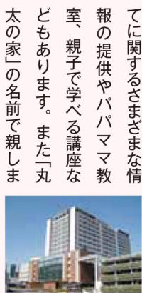
愛知医科大学病院

長久手市では、子育て支援センター事業も充実しており、多様な子育てを応援するプログラムも多彩。子育てに関するさまざまな情報、親子で学べる講座などもあります。また「丸太の家」の名前で親しまれている「平成子ども塾」では、地域ボランティアの協力を得ながら、食と農、自然体験、伝統文化など、さまざまな分野での体験活動を展開。長久手ならではの豊かな自然を活用したユニークな取り組みを行い、年間を通して親子で楽しめるプログラムがいろいろあります。