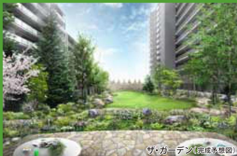
ザ・ガーデン(完成予想図)