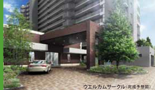
ウエルカムサークル(完成予想図)