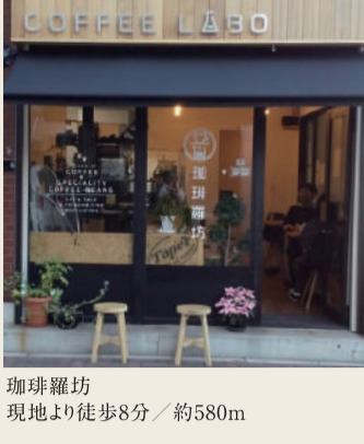
珈琲羅坊 現地より徒歩8分／約580m