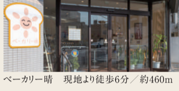
ベーカリー晴 現地より徒歩6分／約460m