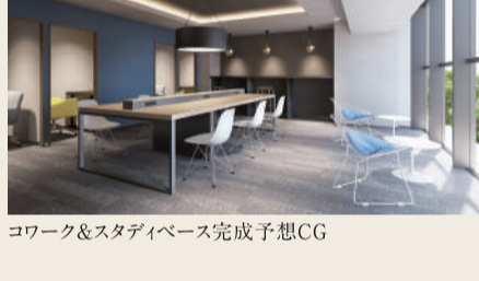
ワーク&スタディベース完成予想CG