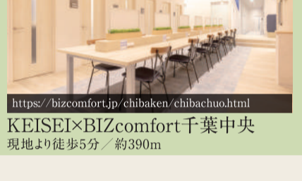
https://bizcomfort.jp/chibaken/chibachuo.html KEISEI×BIZcomfort千葉中央 現地より徒歩5分／約390m